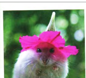
必要のないものが、 実は一番必要